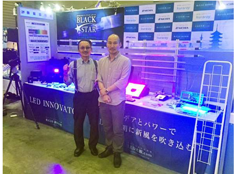
紫外線導光板LED照明