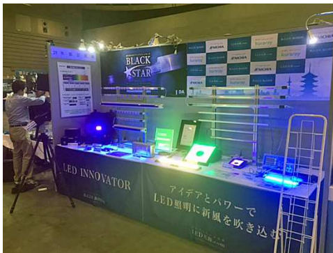
片側斜光導光板LED照明